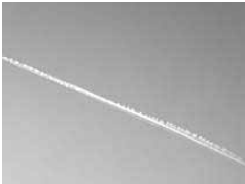
2. Bild: Sich nicht ausbreitender Dauerstreifen