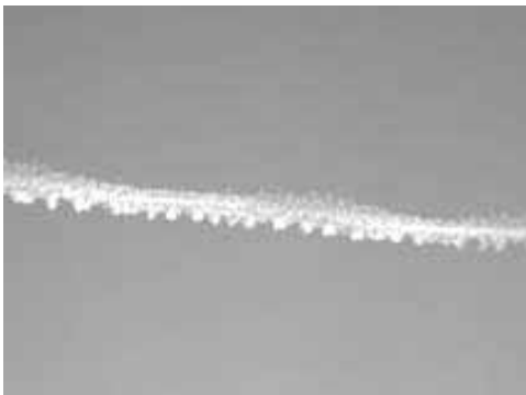
3. Bild: Sich ausbreitender Dauerstreifen