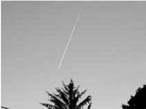
1. Bild: Kurzlebiger Kondensstreifen