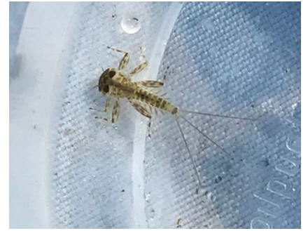
Figure 3 : les larves d'éphémères sont un exemple parmi tant d'autres de la faune aquatique que les élèves peuvent découvrir.