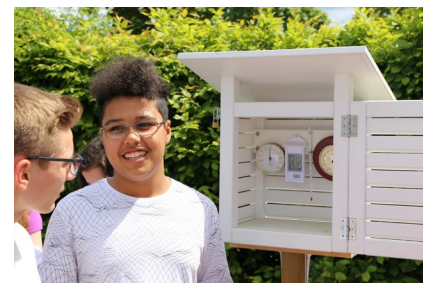
Figura 1: allievi davanti alla capannina meteorologica.

Il pluviometro deve essere fissato a un palo o a una trave di legno di diametro all'incirca uguale a quello del pluviometro. Fissa il sostegno in modo che il pluviometro sporga con il suo orlo superiore di 10 cm sopra l'orlo del palo. Per evitare che spruzzi