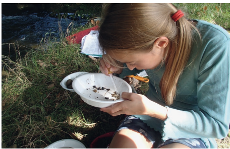
Abbildung 6: Makroinvertebraten beobachten.

Beobachte die Makroinvertebraten in deiner Schale.