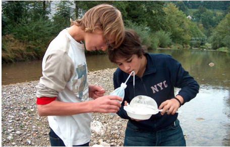
Abbildung 5: Spülen des Siebes.

Spüle die Makroinvertebraten aus deinem Sieb in die Schale.