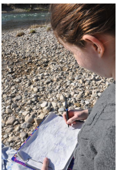
Abbildung 7: Ergebnisse festhalten.

Halte deine Ergebnisse fest ( Auftrag 9 ).