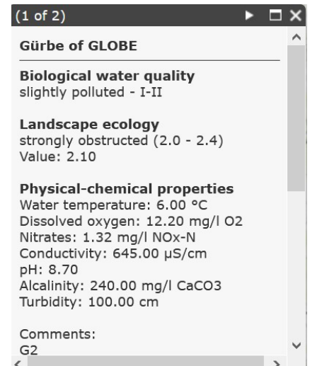
Figure 4 : capture d'écran des données saisies dans l'outil d'analyse sur l'emplacement 2 (G2) dans la Gürbe près de Seftigen.