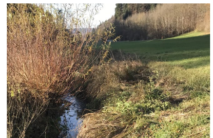
Figure 5 : l'emplacement S2 sur le Sulgenbach à Köniz. De là, le ruisseau s'écoule vers l'emplacement S1 (1) étudié dans ce modèle. La distance entre les 2 emplacements est d'env. 300 m. à vol d'oiseau.