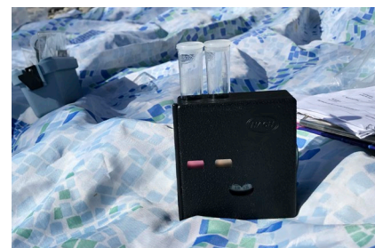
Figure 1 : lors de la mesure de la teneur en nitrates, on effectue une comparaison de couleurs.

Avant de commencer les mesures, se procurer le matériel de mesure nécessaire, sélectionner les emplacements et planifier une sortie pour la collecte des données. Idéalement, les méthodes devraient être testées au préalable avec les élèves.